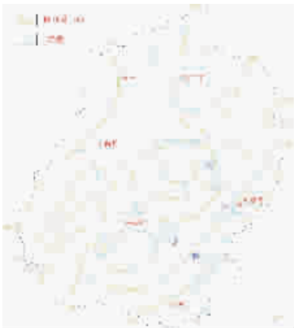
图 1 多年平均降水量图