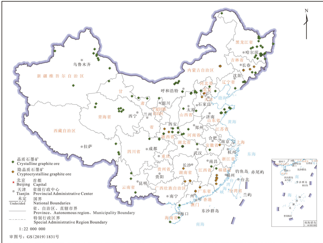
图2 中国石墨矿床分布图 Fig.2 Distribution map of graphite deposits in China

矿床,变质程度主要为角岩相;接触变质型隐晶质石墨矿床成矿时代从晚古生代石炭纪、二叠纪至中生代侏罗纪,其中最重要的是晚二叠世及早侏罗世和晚侏罗世,北方以晚、早侏罗世及石炭纪的较多,南方以二叠纪为主。石墨成矿期和大地构造演化过程密切相关,主要包括中太古代—古元古代、中元古代—早寒武世、晚古生代—中生代三个重要成矿期,其中以中太古代—古元古代区域变质成矿期最为重要(李超等,2015;颜玲亚等,2018)。