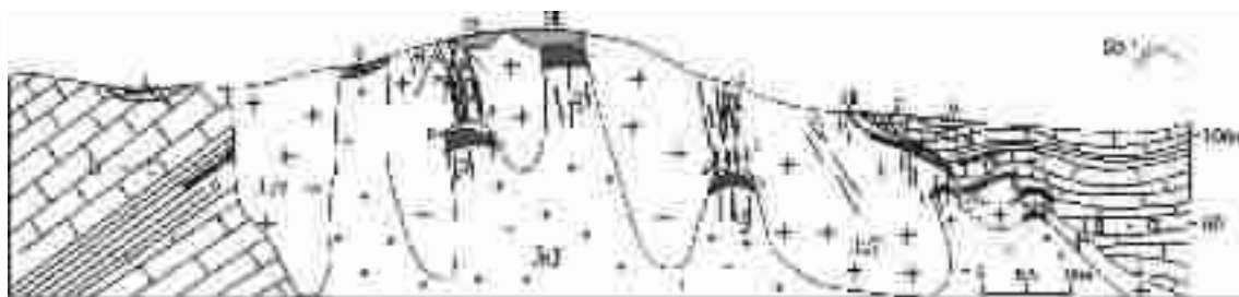
图 2 大义山岩体中各类型锡矿体分布示意图 ①

侵入体的形态、产状也影响了矿化的空间分布。蚀变花岗岩型锡矿往往分布在长条形的介头单元侵入体的上拱部位,即东西、南北两方向的“背形”部位。当其上有伟晶岩盖时,矿化富集(图 2)。夕卡岩型锡多金属矿主要分布于岩体产状比较平缓的一侧,尤其是岩体接触面出现凹陷曲折、超覆的地段,矿化富集。似层状锡石—硫化物型锡矿主要产于岩体