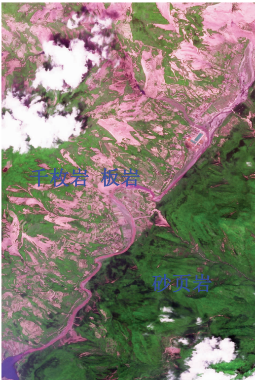
图 5 河谷两侧岩性不同地灾发育程度大不相同 Fig.5 Remarkable difference in distribution of geohazards between different lithologic areas

风化层厚的北川岷江灾害类型以滑坡居多,且由于风化层面与坡面方向一致,所以导致滑坡规模较大,由此堵塞江河,形成许多堰塞湖。而汶川多以岩体崩塌为主。由于基岩岩层面大多不与坡面倾向一致,所以不易形成滑坡,多以崩塌形式出现。且崩塌体的规模比松散的与坡面一致的风化层发生的崩滑要小得多。虽然也造成江河堵塞,但像北川那样大规模的堰塞湖没有出现。