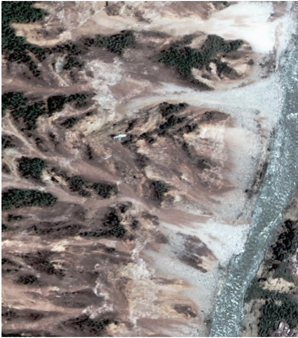
图3 岷江右岸密集发育的崩塌