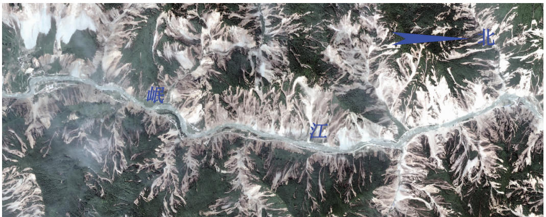
图 2 汶川岷江两岸带崩滑成带状密集发育(图中浅色图斑均为崩滑)

⑤衍生性(次生性)灾害长期存在。由地震地质灾害衍生的次生地质灾害将长期存在又是这次汶川地震地质灾害的一大特点。由于崩滑产生的巨量松散岩土体堆积在谷坡山脚,一方面,这些堆积体为泥石流的发生提供了充足的物源,泥石流灾害在震区