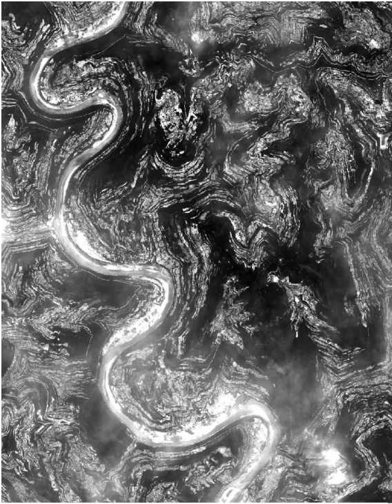
图 6 四川苍溪水平岩层区地灾稀少