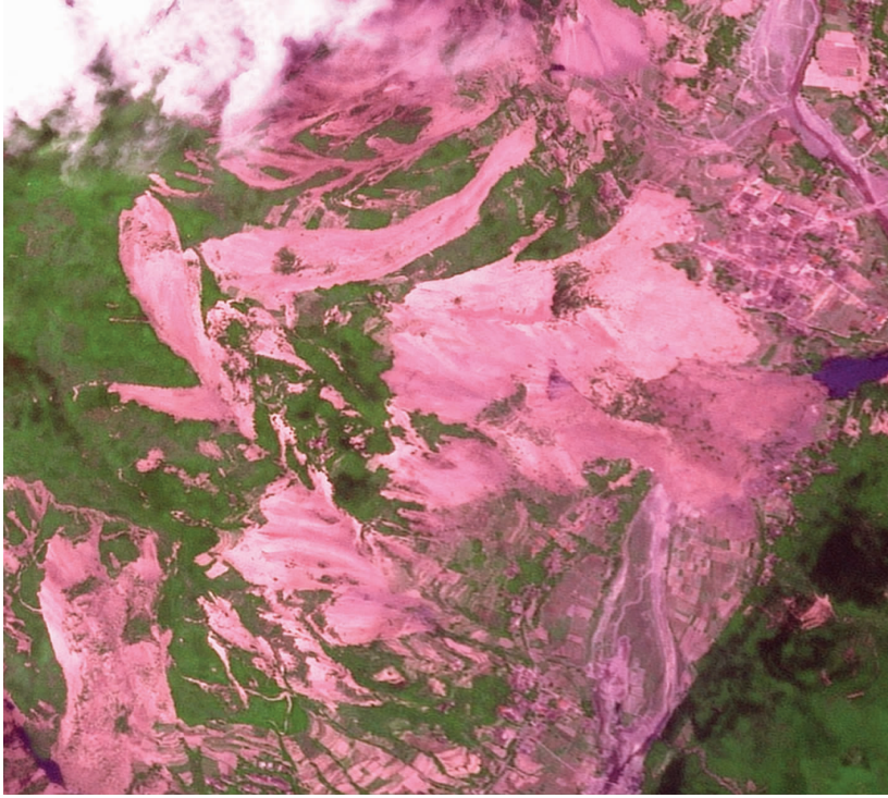
图 4 发育于北川的风化层滑坡群(图中粉红色图斑均为滑坡) Fig.4 Weathered material landslides in Beichuan County(pink spots in the image mean landslides)