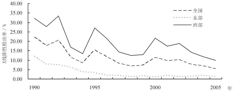
图1 全国大骨节病病情监测时间动态图 Fig.1 Temporal dynamics of KBD prevalence rate in China