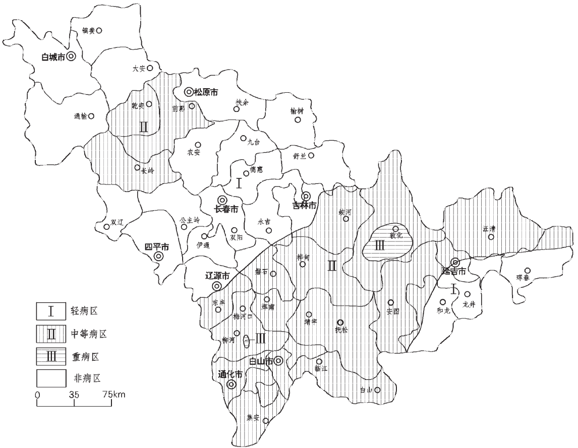
图1 吉林省大骨节病分布略图