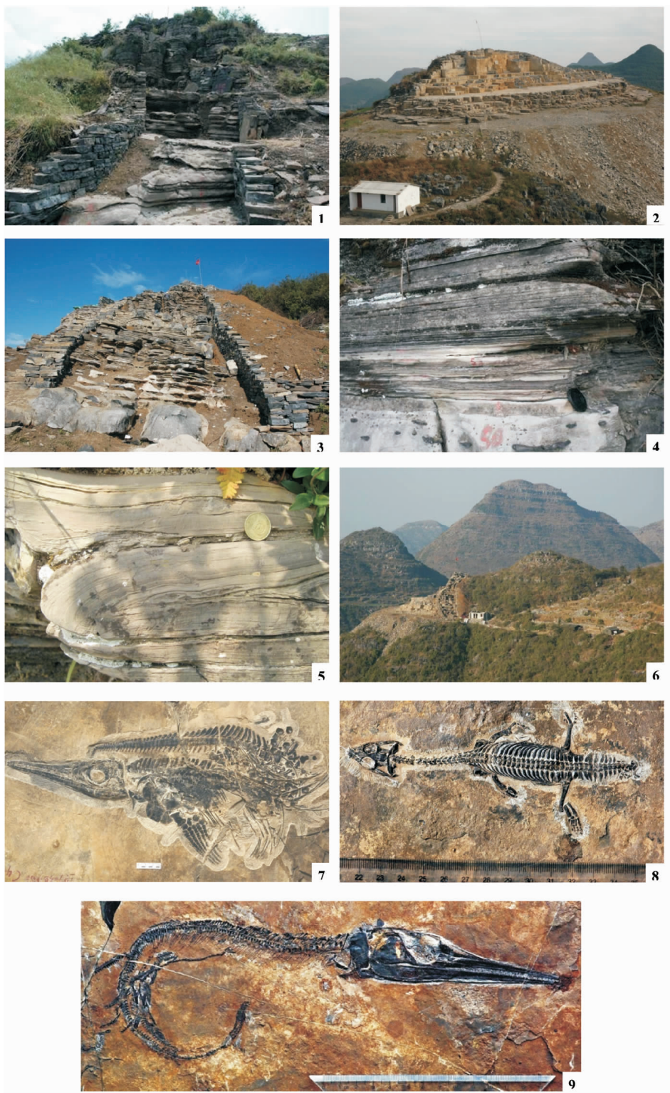
图版 I (Plate I)

说明:1—上石坎剖面;2—罗平生物群一号采场;3—大凹子剖面;4—水平纹层;5—包卷层理;6—罗平生物群二号采场;7—鱼龙类化石—盘县混鱼龙相似种;8—肿肋龙类化石—丁氏滇龙;9—鱼类化石—云南龙鱼