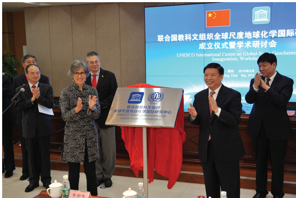
联合国教科文组织全球尺度地球化学国际研究中心正式成立

“化学地球”大科学计划研究内容包括:一是建立覆盖全球地球化学基准网,获得20000个基准点76个化学元素基准数据;二是建立中国关键带地球化学观测网,长期观测化学元素及其化合物在岩石圈、水圈、土壤圈、大气圈和生物圈的循环;三是开展“一带一路”地球化学填图,圈定铀、金、铜、稀土等矿产资源远景区;四是基于全球地球化学基准值,估算全球资源总量;五是监测全球重金属、放射